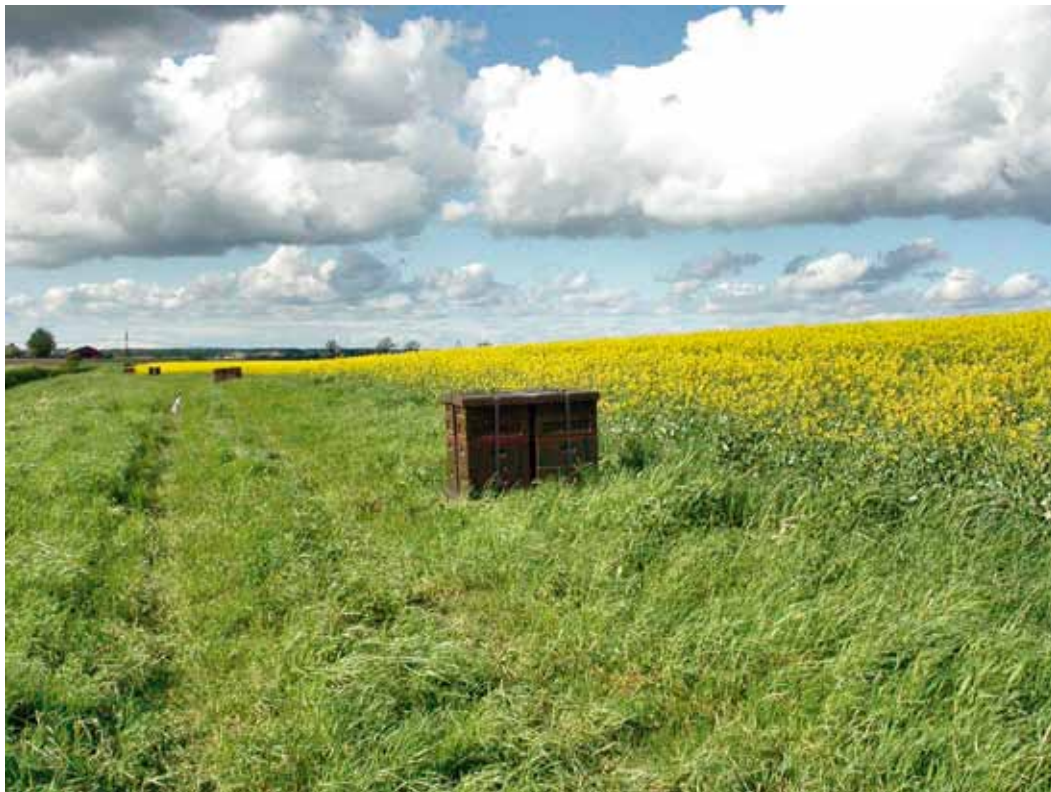
Bild 3. Värdet av pollineringen bör tas med i kalkylerna om du odlar grödor som gynnas av pollinering, till exempel höstraps.

Om du avser att utöka din verksamhet med biodling gäller det att hitta de effekter där verksamheterna samverkar. Om du är oljeväxtodlare kan du skaffa bikupor för att förbättra pollineringen. Då kan du räkna in både den ökade oljeväxtproduktionen och honungsproduktionen som intäkter i verksamheten. För dig som har gårdsbutik är egenproducerad honung ett tillskott i sortimentet.