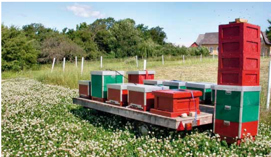
Bild 1. På de flesta lantbruk har man vagnar eller släp som kan användas till transport av bisamhällena.

Eftersom hela bisamhällen och fulla skattlådor är tunga bör du ta stor hänsyn till ergonomi när du planerar transporterna.