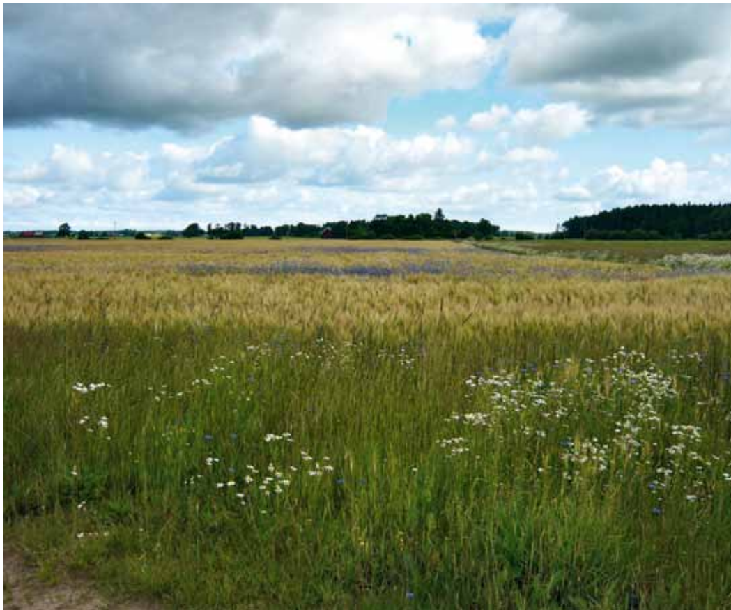
Bild 2. Blåklint har en mycket sockerrik nektar och blommor sent. Blåklint i korn minskar spannmålsskörden men ökar honungsskörden.

slättlandskapet. Ofta är djurhållning huvudriktningen för jordbruket. Att kombinera biodling med annan djurhållning går bra, men det kräver planering. Det gäller att bina inte fordrar arbetsinsatser under de dagar då vallskörden pågår. Genom att placera spärrgaller framför bikupans öppning (flustret) under de dagar vallskörden pågår, minskar du risken för att bina svärmar. Spärrgallret är ett galler med en maskvidd som arbetsbina kan ta sig igenom men där bidrottning och drönare hindras. Bina måste få utrymme i kurna innan vallskörden, för när vädret är lämpligt för vallskörd är nektardraget ofta också bra.